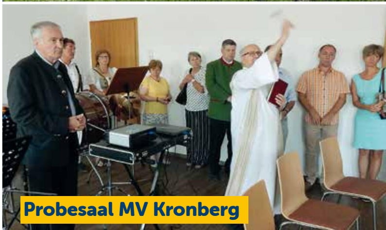
Probensaal MV Kronberg