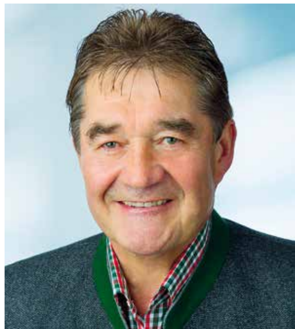
Bürgermeister Ernst Bauer

Unterstützen Sie mich und mein Team bitte durch Ihre Stimme.