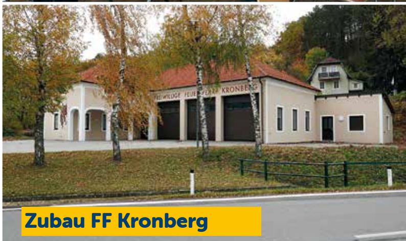
Zubau FF Kronberg